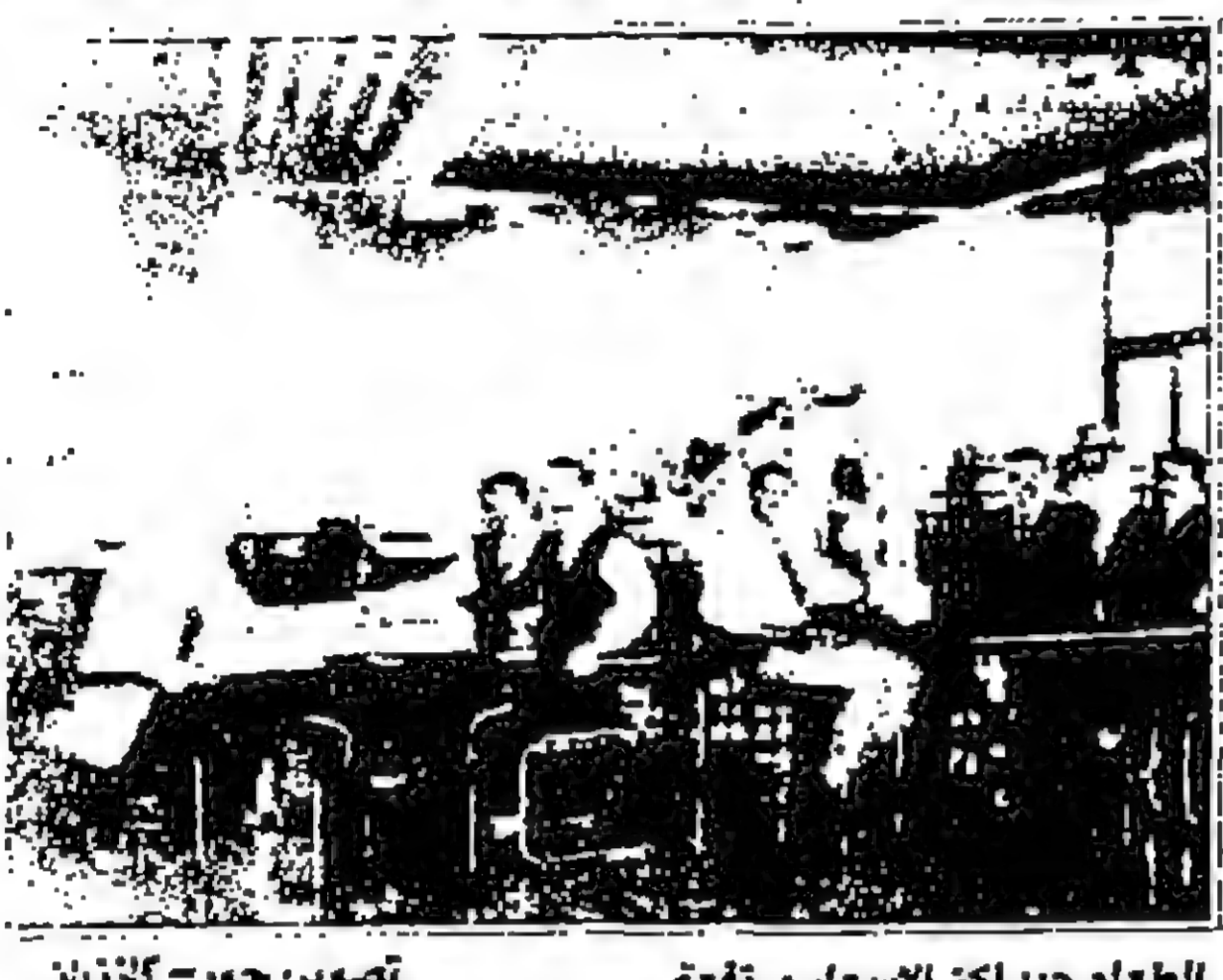
الطعام جيد لكن الاسعار مرتفعة

اجرت اللقاءات: ملك يوسف التل يعتاز شهر رمضان المبارك بأجوائه الخاصة والناضرة، ومع ارتفاع صوت اذان المغرب فان حالة من الخضوع تصفي بغلاتها الشقيقة على المؤمنين حالة من التعاضد الايماني لا يعرفها الا الصائم. وقد يتناول المواطن افطار في بيته، مع أسرته واطفاله، فان كثيرين يتناولون طعام افطارهم في اماكن عملهم، هؤلاء الجنود المجهولون الذين تضطربهم ظروف عملهم الى ذلك، لا يخفف عنهم اجر عبادتهم عن أسرهم في اوقات تناول طعام الإفطار في رمضان الا الشعور بالمسؤولية تجاهنا كمواعين، وذلك التعاضد الايماني الذي يلقينا بعبادته الدافئة، كمؤمنين يشهد بعضهم البعض كالمؤمنين للرسول. «الدستور» من جانبها، وكعادتها في تغطية الاحداث وفي التفاعل مع قضايا المواطنين تلقي الضوء على هؤلاء الجنود المجهولين الذين بتفانيهم يجعلون الوطن اجمل: